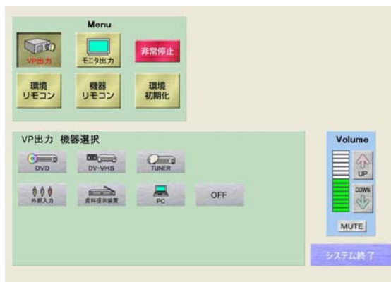
ビデオプロジェクト出力機器選択画面

プロジェクトやモニターに出力する映像切り替えや音量調整がタッチパネルから簡単に行うことができます。