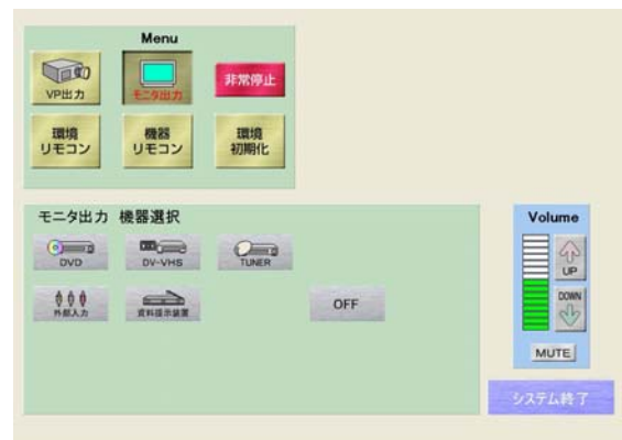
モニター出力機器選択画面