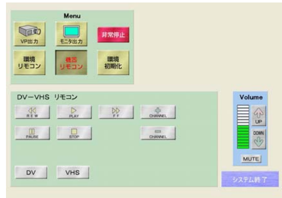
機器リモコン画面（VHS）