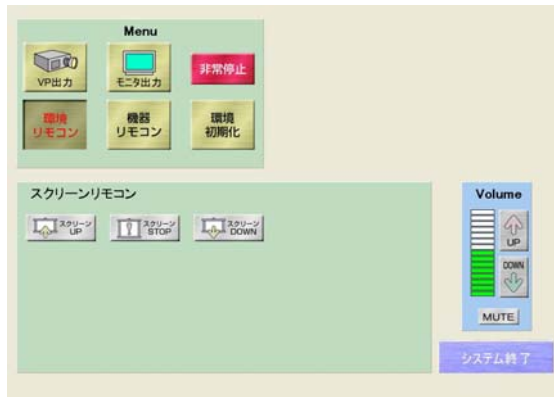
環境リモコン画面（スクリーン）

プロジェクターやモニターに出力する映像切り替えの他に、DVDやVHS等の機器リモコン・スクリーンや照明等の環境リモコンをタッチパネルから行うことができます。