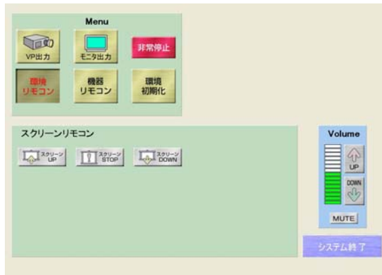
環境リモコン画面（スクリーン）

プロジェクターやモニターに出力する映像切り替えの他に、DVDやVHS等の機器リモコン・スクリーンや照明等の環境リモコンをタッチパネルから行うことができます。